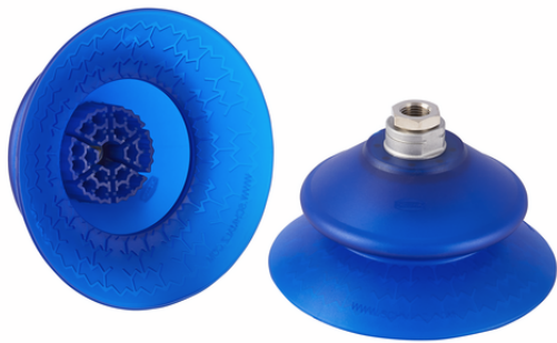
SAXB 120 ED-85 G1/4-IG