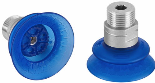
SAXB 40 ED-85 M16-AG