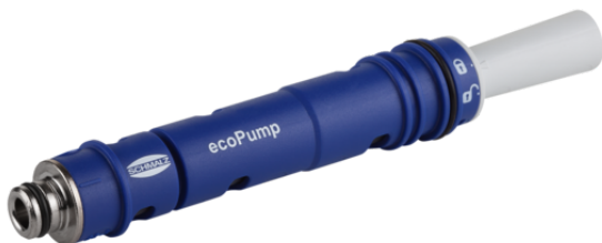
SEP HV 3 16 22 S