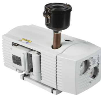
EVE-TR 10 AC F