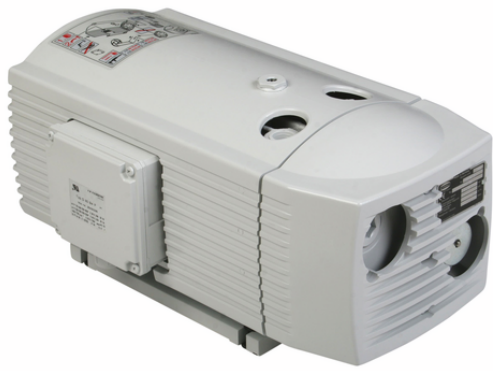
EVE-TR-X 40 AC3 IE3-TYP2 F-VB