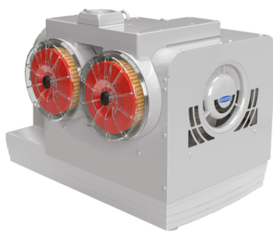
EVE-KL 300 AC3 IE3-TYP4 F

爪式泵 EVE-KL 有三种规格可选，适用于所有常见的电源电压，可作为即插即用型产品使用。