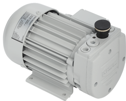
EVE-TR 8 AC3