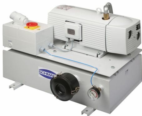
VZ-TR 25 AC3 50 GMS