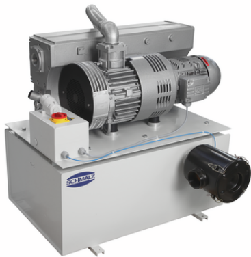
VZ-OG 165 AC3 200