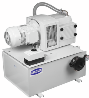
VZ-TR 80 AC3 100 MS IE3-TYP1