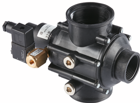
EMVP 50 230V-AC 3/2 NO