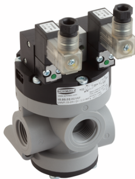
EMVP 25 24V-DC 3/2 IMP