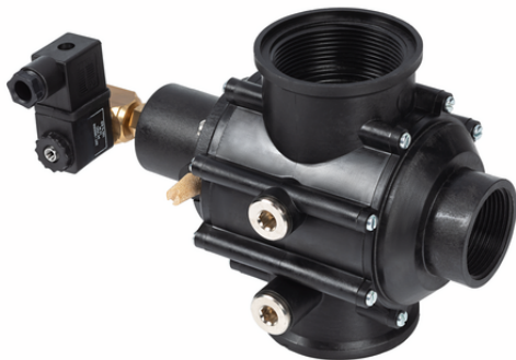
EMVP 50 24V-DC 3/2 NC