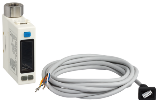
FS 10 D 2NA K