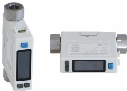
FS 100 D 2PA K