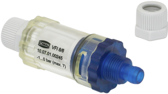
VFI CN8/6 50