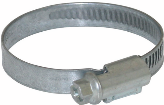
SSB 32-50 ST-VZ