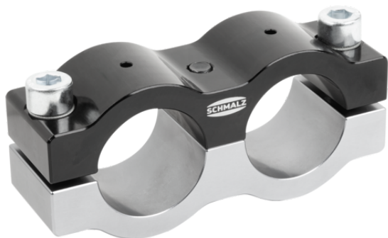
SXT-CL P 40 40 AL