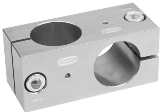
SXT-CL X FIX 40 40 AL