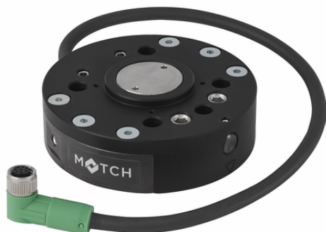
RMQC 50 YAS DIO WB-M8-8 PNP MATCH